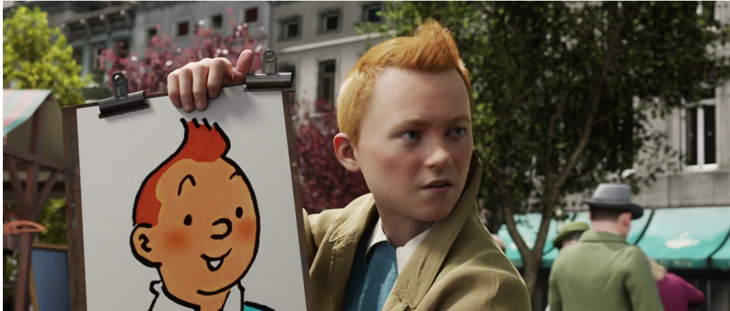
FIGURE 3 – Ouverture des Aventures de Tintin : Le Secret de La Licorne

La surface plane 2D et la technique particulièrement simple de la ligne claire offre avec le relief, lunettes 3D sur le nez, un contraste tout à fait saisissant. L'effet fait figure de choc pour le spectateur, qu'il apprécie ou non la conversion. Comment ce contraste se matérialise-t-il via cette technologie sur un simple plan, c'est Martin Scorsese qui nous apporte la réponse malgré lui dans une interview sur Hugo Cabret :