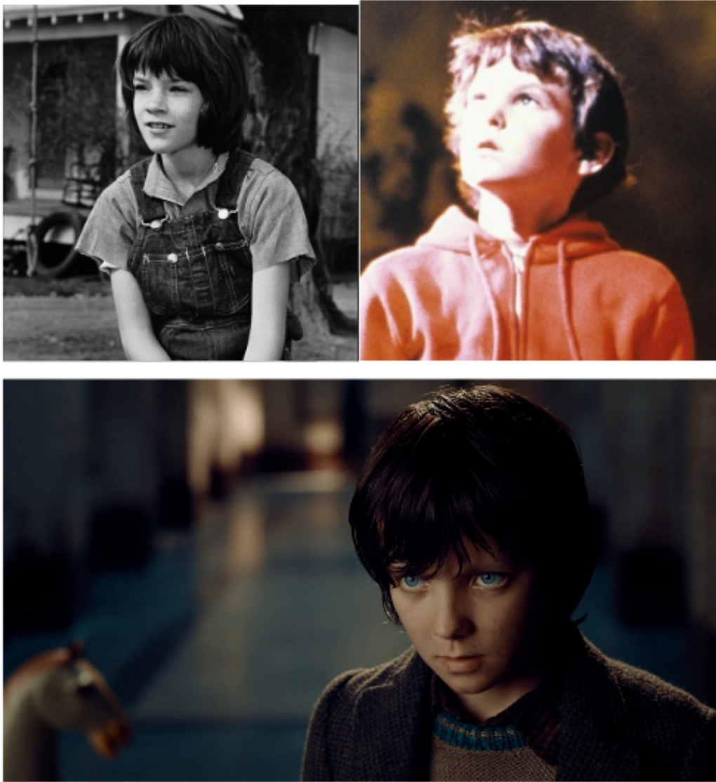
FIGURE 2 – Haut gauche : « Scout » (Mary Badham) dans Du silence et des ombres ; Haut droite : Elliott (Henry Thomas) dans E.T., L'extraterrestre ; Bas : Hugo Cabret (Asa Butterfield) dans le film éponyme

Les technologies numériques au service de la cinéphilie : l'hybridation ciné-picturale dans Tintin de Steven Spielberg et l'immersion cinéphile dans Hugo Cabret de Martin Scorsese