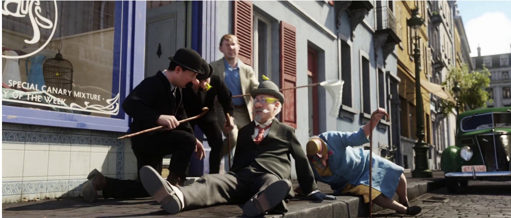
FIGURE 4 – Les oisillons hallucinatoires de la bande dessinée deviennent réels dans le film de Spielberg !

Les technologies numériques au service de la cinéphilie : l'hybridation ciné-picturale dans Tintin de Steven Spielberg et l'immersion cinéphile dans Hugo Cabret de Martin Scorsese