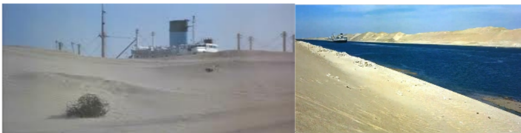
FIGURE 5 – Du mirage du paquebot dans le désert à la réalité du canal de Suez. Lawrence d'Arabie

L'immersion totale du spectateur et la mise en scène façon « montagnes russes » atteignent alors leur paroxysme lorsque le spectateur se retrouve